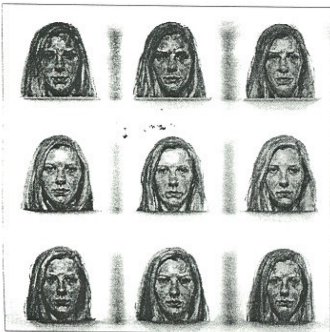
"3 x 3" (3 days a week for 3 weeks with Jessica), de Clive Smith