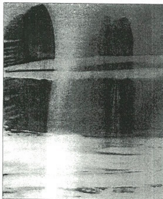
"Sin título", 2003, de Delia Piccirilli

• Galería Luis Gurriarán, Santo Tomé, 6. Hasta finales de julio.